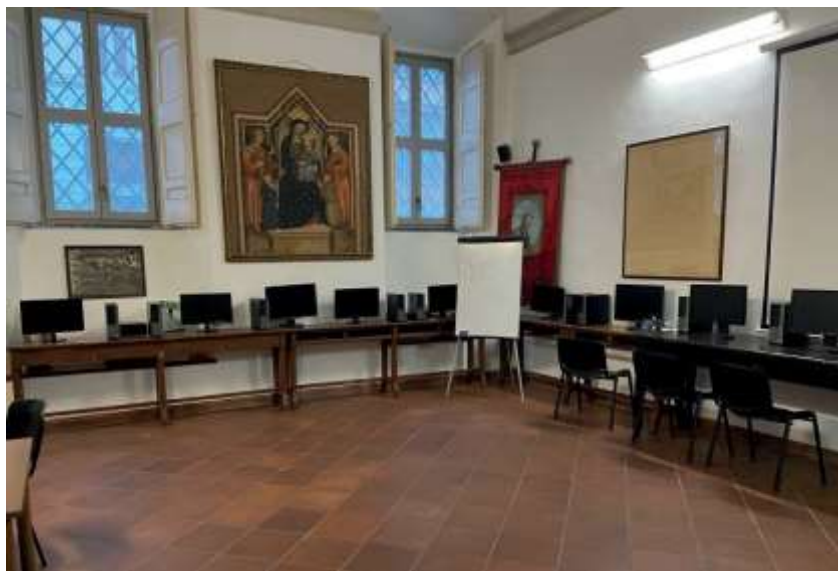
▲ PARROCCHIA SANTA MARIA AI MONTI - ROMA

Le singole donazioni concorrono a comporre il valore totale dell'allestimento di un'aula digitale.