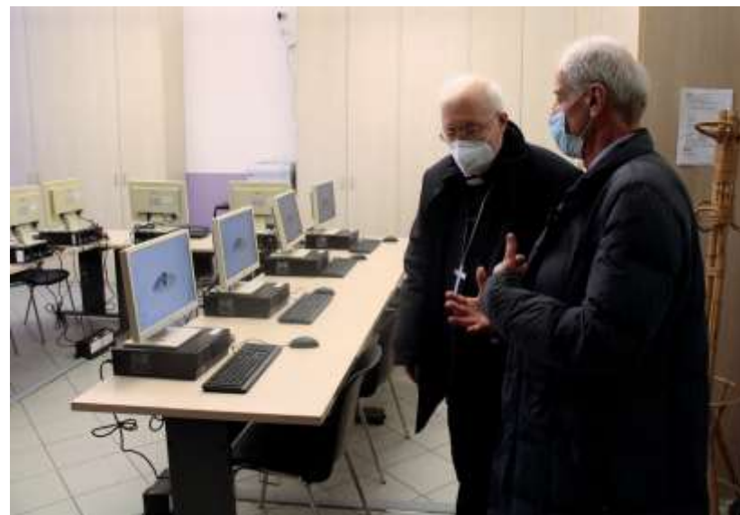
▲ UFFICIO PASTORALE MIGRANTI - UPM TORINO

Inaugurazione dell'aula digitale alla presenza dell'arcivescovo di Torino Mons. Cesare Nosiglia.